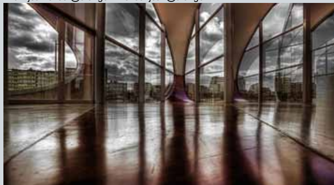
'Urban Nautilus', Médiacité - Liège, photographie, 72 x 52 cm

12 rue Carlier-Hennecart - 02000 Laon - France +33(0)3 23 79 39 04 - GSM : +33(0)6 07 73 04 86 Mail: jean.enser@orange.fr - enser.jean@orange.fr