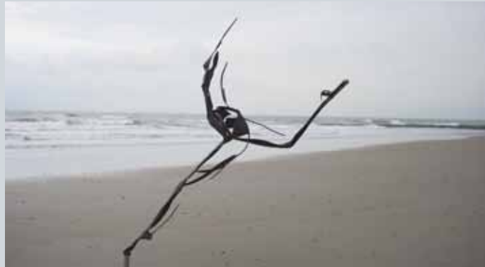
'Alegria' (danseuses), Bronze 1/8 - 95 cm

adeliefjeslaan 64 - 8400 Oostende - Belgique +32(0)472/266.519 Web: http://www.martinevivey.be