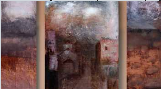
'Brume' (tryptique), huile sur bois.

rue du Palais de Justice, 8 - 5500 Dinant - Belgique +32(0)82/745.269 - +32(0)495/660.158 Mail: laurenceburvenich@hotmail.com - Web: http://laurenceburvenich.skynetblogs.be