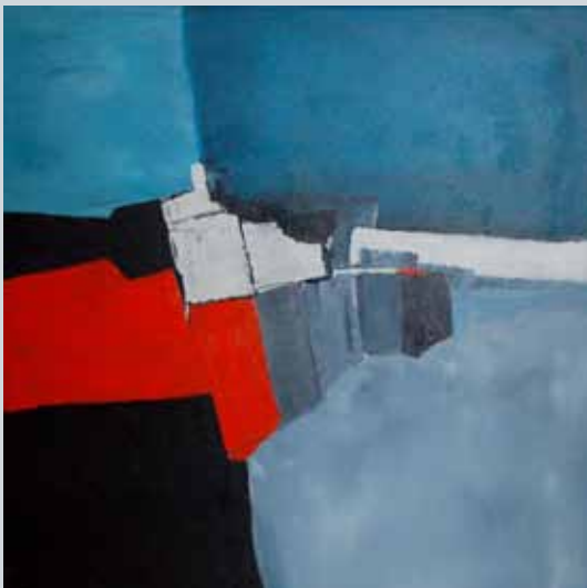
'Voyage', acrylique, 80x80cm

Direction : Michel MATHY - Tel: +32 (0)486/134.659 Contact: michelmathy@balastra.be Web: www.balastra.be