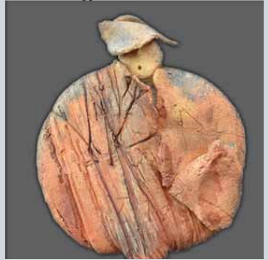
'Homme de terre et de feu', céramique, cuisson four papier, 33 cm

rue tomballes 12 - 4218 Couthuain - Belgique +32(0)85/712.402 Mail: corine.linotte@gmail.com - Web: www.corine-linotte.com