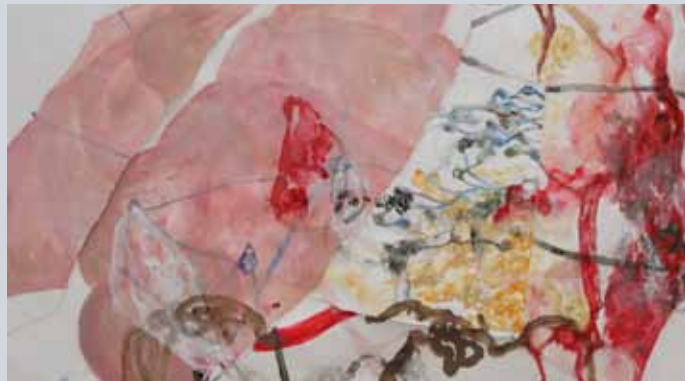
'La chair des images', technique mixte sur papiers cousus, 158x111cm, 2010

+32(0)495/489.211 Mail: info@judithduchene.be - Web: http://www.judithduchene.be