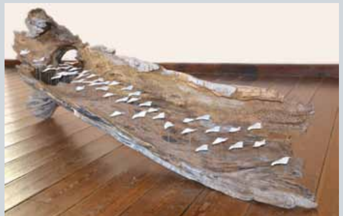
'Esprits de la forêt', bois et céramique. 250x80x60 cm

Montegnet, 18 - 5370 Flostoy - Belgique +32(0)477/773.450 Mail: fb959793@skynet.be - Web: http://www.jeanphilippepiret.com