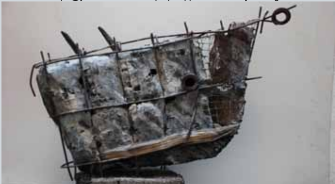
'Esquif' (Boat), béton, métal, pierre. 80x70x10 cm.

Rue Tomballes 6 - 4218 Couthuin - Belgique. +32(0)85/713.823- +32(0)474/326.677 Mail: kesslerph@yahoo.fr - Web: http://philippekesseleser.skynetblogs.be