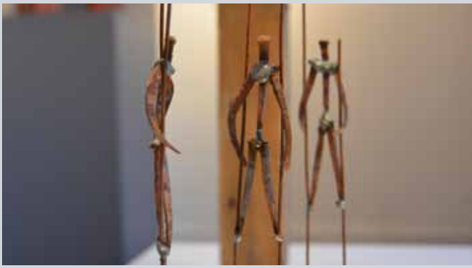
'Echassiers', métal, 30cm