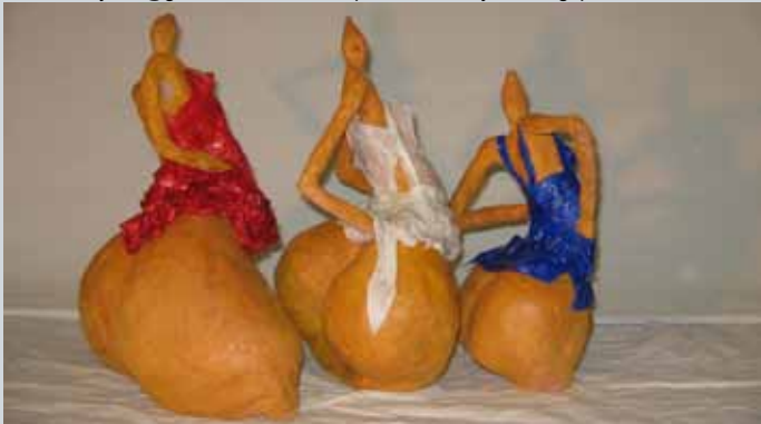
'Le défilé des demoiselles', argile et papier. 30x35 cm

23, chemin des mélèzes - 5000 Namur - Belgique +32(0)473/490.876 Mail: cmayeux@gmail.com - Web: http://corinnemayeux.blogspot.com